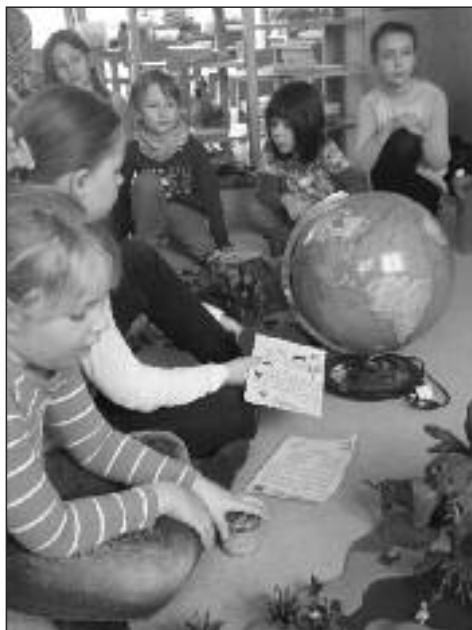
Auf dem Globus wurden die Philippinen gesucht.