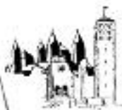
Gemeinde Mariä Himmelfahrt