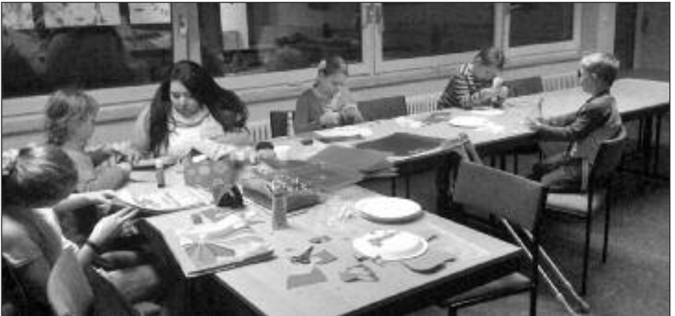
Die Kinder hatten auch ohne Eltern viel Spaß.