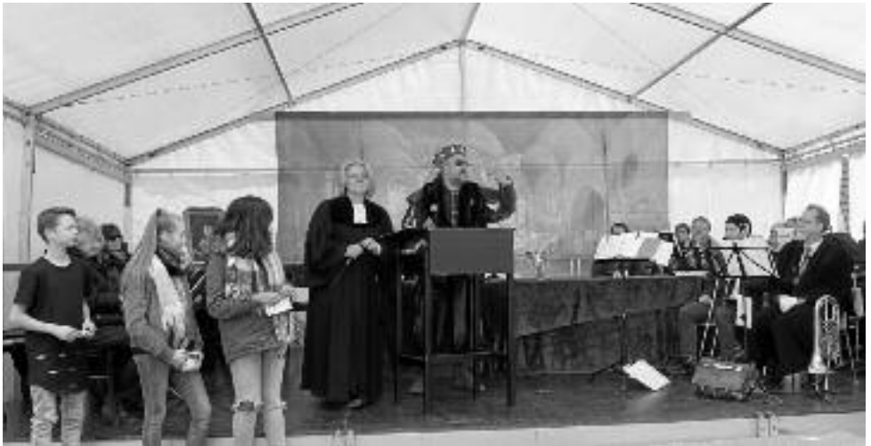
Historischer Gottesdienst am 23. April 2017 im Paradiesgarten.

Ein ökumenisches Vorbereitungsteam aus Anwohnern, Pfarrerin und Gemeindefereferentin sowie der Posaunenchor der Gesamtkirchengemeinde sind für die Gestaltung verantwortlich.