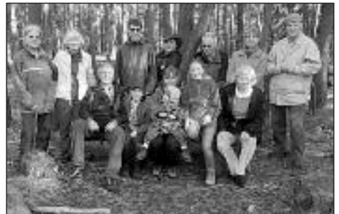
Die Wanderer zur Hohen Loog.