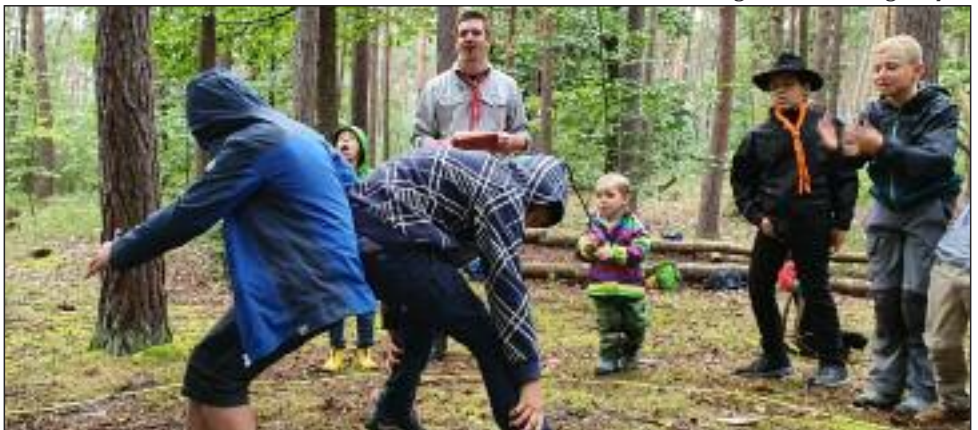
Die Wölflinge beim „Po-Ringkampf“.