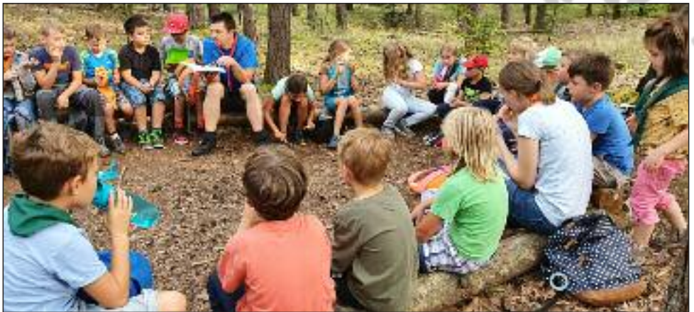
Nach allem Toben und Spielen gibts am Ende immer eine biblische Geschichte!